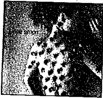
Emilie Simon Emilie Simon Universal

El pop electrònic francès ha acollit amb fastos el debut d'aquesta compositora i intèrpret de veu